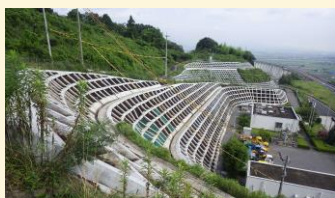
斜面安定・保護対策工事