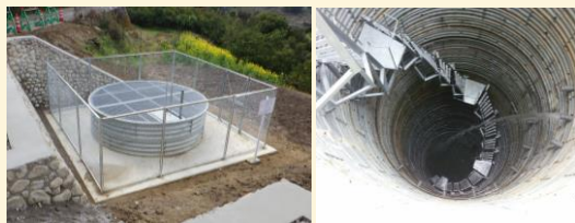
地すべり対策工事